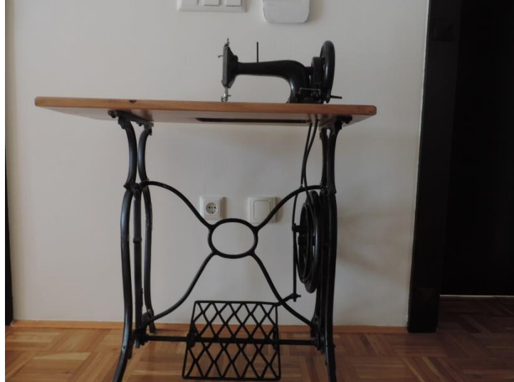
Slika 1: a Obutev. (Vir: Zafošnik M., 2015); b šiviljski stroj. (Vir: Zafošnik M., 2015)