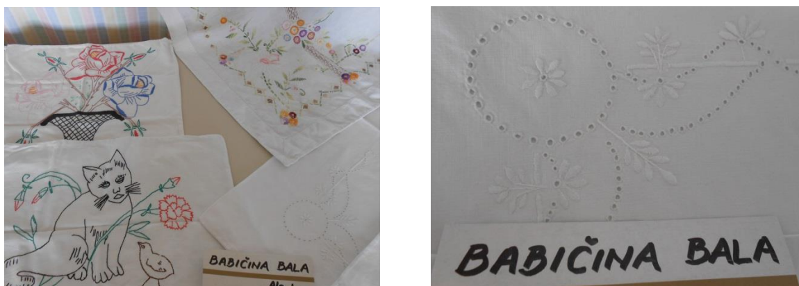
Slika 4: a Babičina bala (Vir: Brumen A., 2016); b babičina bala (Vir: Brumen A., 2016)

Navadno je bila gostija doma, odvisno od tega, kje je bilo dovolj prostora. Včasih je bila gostija en dan pri nevesti, drugi dan pri ženinu ali obratno. Čez en teden je bilo pogostvaje 32 v ožjem krogu, povabljene so bile priče, brati, sestre in starši. Nevesta je zapustila dom in odšla na možev dom z doto, ki je vsebovala posteljnino, prte, posodo, porcelan in steklo (Pulko, 2016; Šešo, 2015).