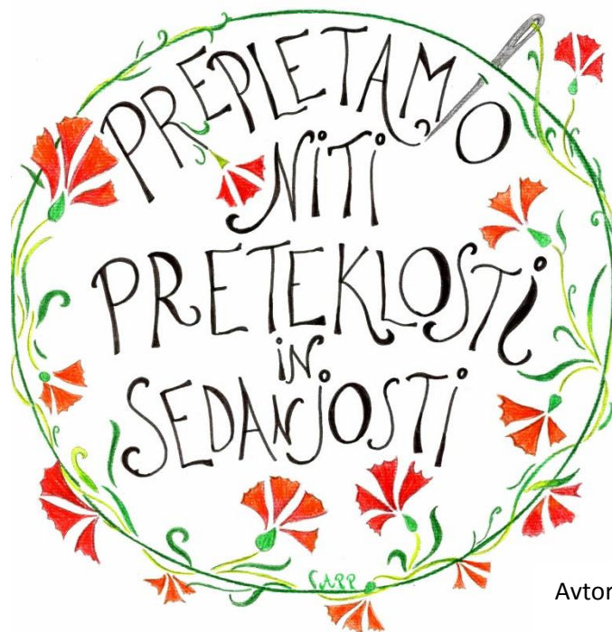
Avtorica ilustracije: Andreja Pevec Podgornik, 9. a

Naše delo je le kamenček v bogatem mozaiku raziskav kulturne dediščine naših prednikov. 11.4. 2016 se bomo predstavile tudi ob dnevu šole, ki bo nosil naslov Prepletamo niti sedanjosti in preteklosti.