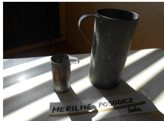
Slika 5: a Leseno kolo z lojtrnika (Vir: Brumen A., 2016); b merilne posodice (Vir: Brumen A., 2016)