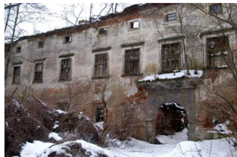
Slika 3: a Grad Ravno polje – nekoč; b grad Ravno polje – danes