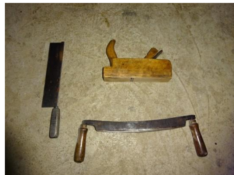
Slika 2: a Koš za prenašanje sena (Vir: Metličar I., 2016); b orodje (Vir: Metličar I., 2016)