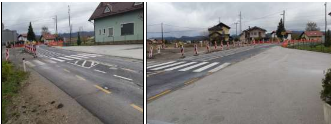
Fotografiji 8, 9: Nevarna točka pri prečkanju regionalne ceste Majšperk - Ptuj

Za učence, ki se vozijo s kolesi ali gredo peš, je najnevarnejša točka tam, kjer prečkajo regionalno prometno cesto Majšperk – Ptuj (Lovrenško cesto), nato pa se po nevarnem odseku zapeljejo do kolesarske poti ob Tovarniški cesti. Na pešce opozarja le prometna signalizacija. Pot nadaljujejo po urejeni kolesarski stezi ob Tovarniški cesti do Kidričevega (slika 5).