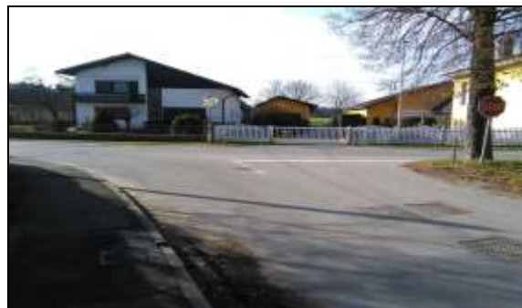
Fotografiji 3, 4: Nevarni točki pri prečkanju regionalne ceste Maribor - Kidričevo