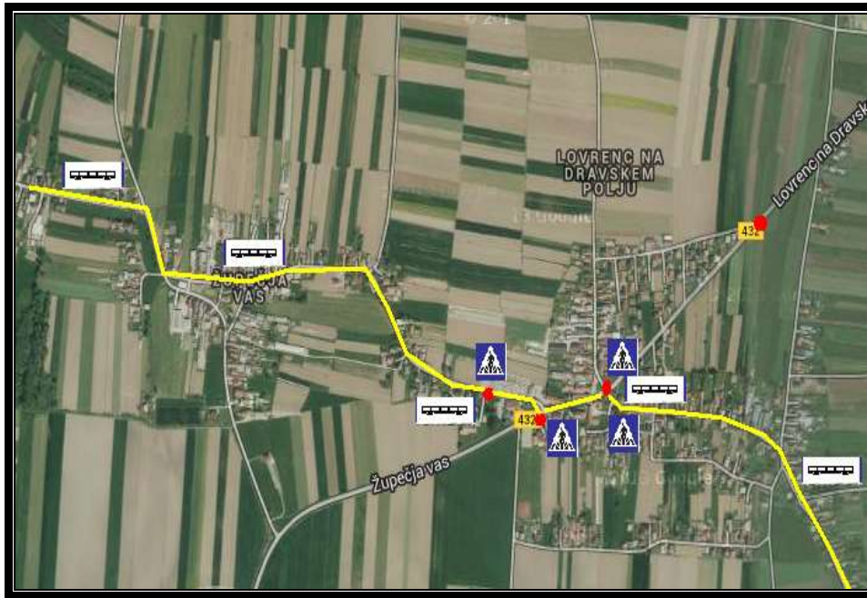
SLIKA 6: Šolska pot - najvarnejši prihod z avtobusom in nevarne točke – učenci iz Pleterj, Župečje vasi, iz Lovrenca na Dr. polju