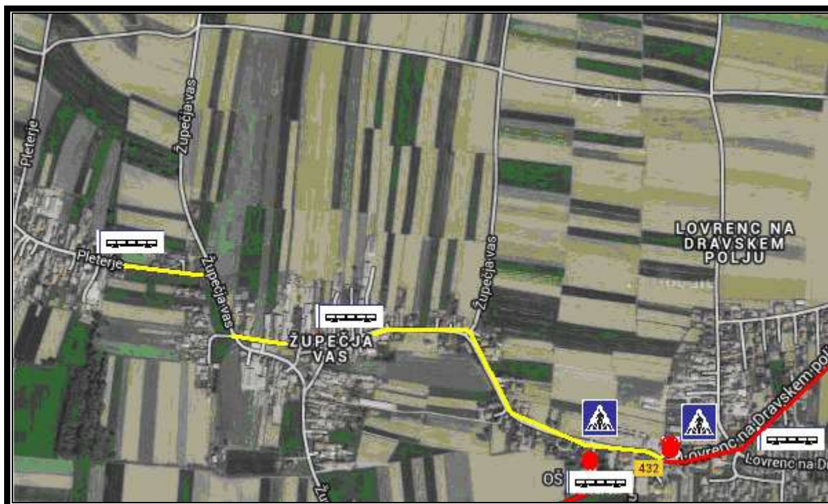
SLIKA 7: Šolska pot in nevarne točke, nevarni odsek – najvarnejši prihod z avtobusom - učenci iz Pleterj, Župečje vasi, iz Lovrenca na Dr. polju