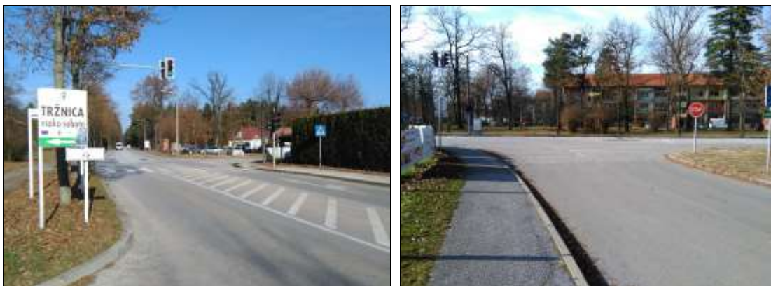
Fotografiji 1, 2: Nevarni točki pri prečkanju Tovarniške ceste