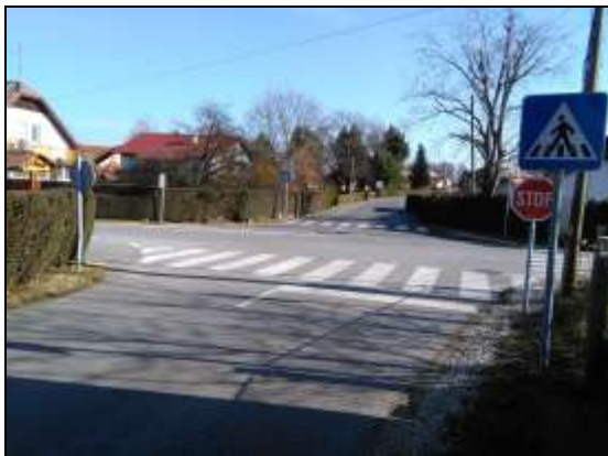
Fotografija 7: Nevarna točka

Za učence, ki se vozijo s kolesi ali gredo peš, je najnevarnejša točka tam, kjer prečkajo regionalno prometno cesto Majšperk – Ptuj (Lovrenško cesto), nato pa se po nevarnem odseku zapeljejo do kolesarske poti ob Tovarniški cesti. Na pešce opozarja le prometna signalizacija. Pot nadaljujejo po urejeni kolesarski stezi ob Tovarniški cesti do Kidričevega (slika 5).