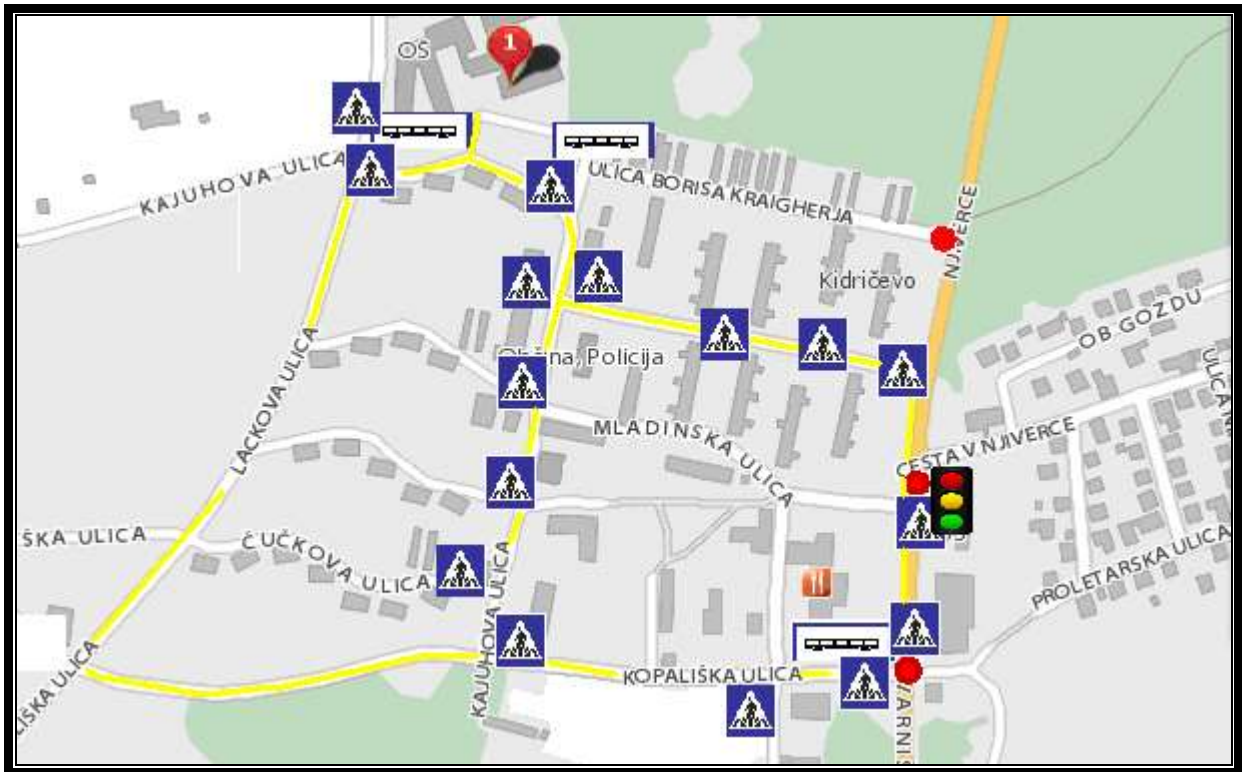
SLIKA 1: Šolska pot in nevarne točke – učenci iz naselja Kidričevo