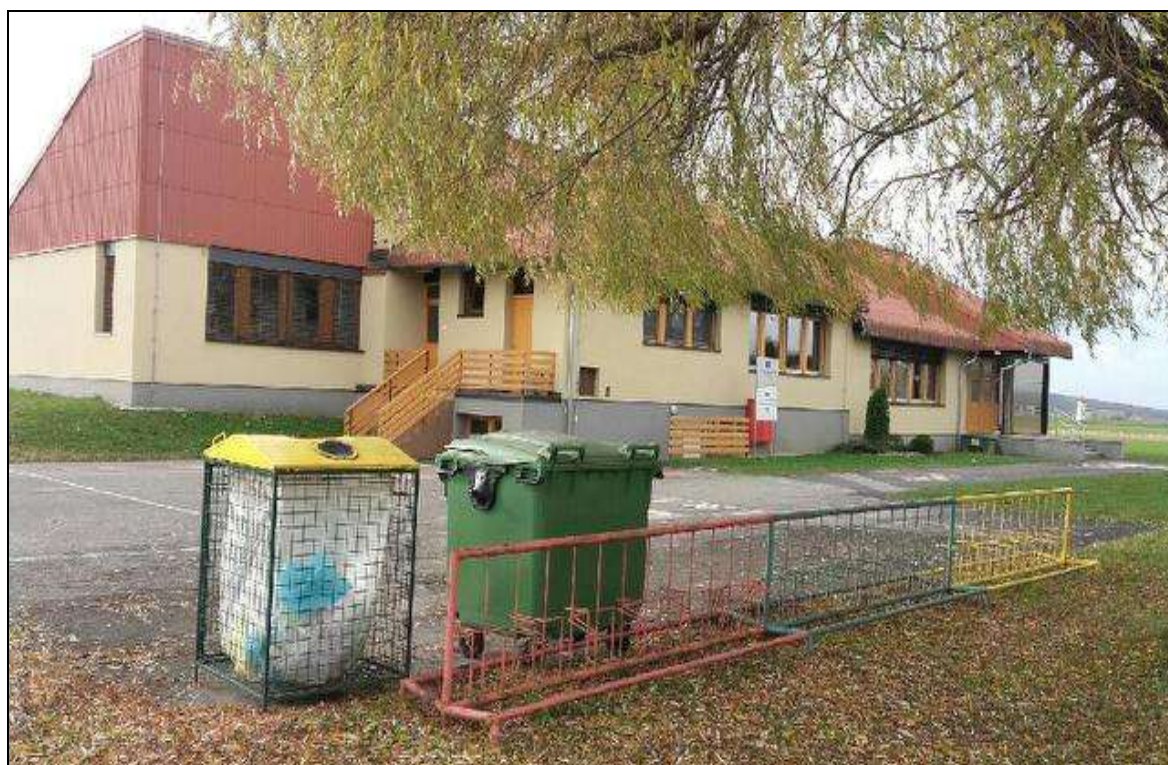
Fotografija 11: Podružnična šola Lovrenc na Dravskem polju

* Učenci iz Apač ob povratku domov koristijo redne avtobusne linije, ki so hkrati šolske linije.