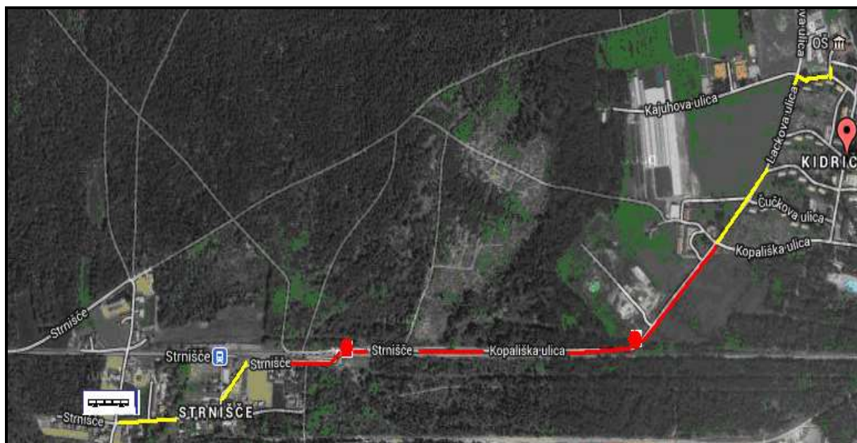
SLIKA 3: Nevarni točki, nevaren odsek brez pločnika ali kolesarske steze – učenci iz Strnišča: najvarnejši приход z avtobusom