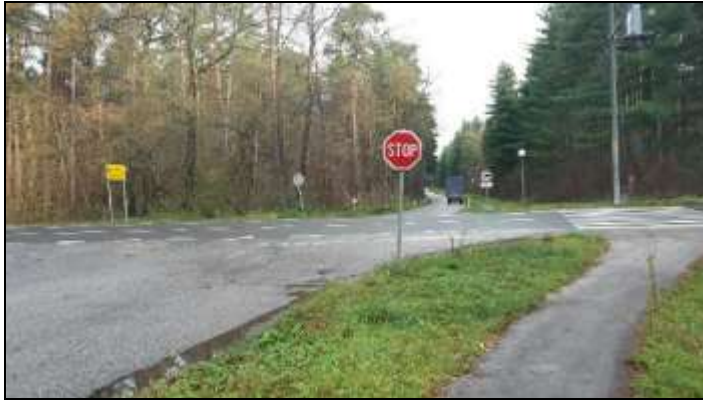
Fotografija 6: Nevarna točka pri prečkanju regionalne ceste Slovenska Bistrica – Ptuj