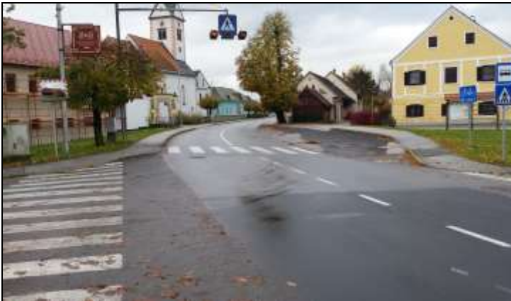
Fotografiji 10, 11: Nevarni točki pri prečkanju regionalne ceste Majšperk - Ptuj