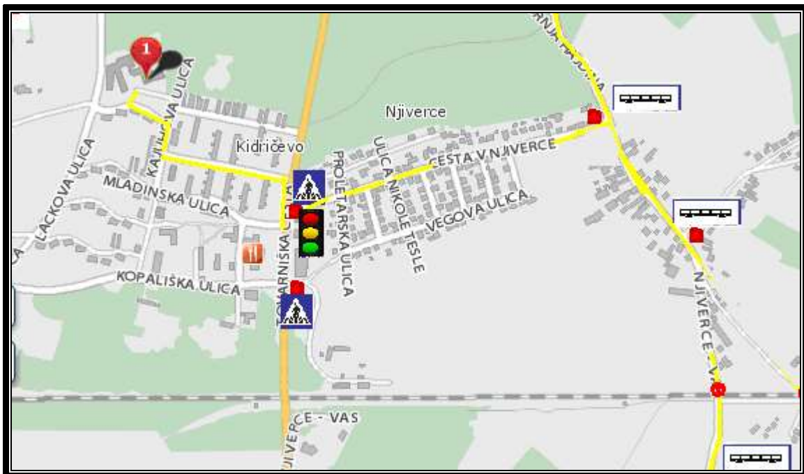
SLIKA 2: Šolska pot in nevarne točke - učenci iz Njiverce Njiverce – Vas: najvarnejši prihod z avtobusom