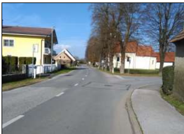
Fotografija 5: Nevarna točka pri prečkanju ceste pri avtobusni postaji – ni prehoda za pešce