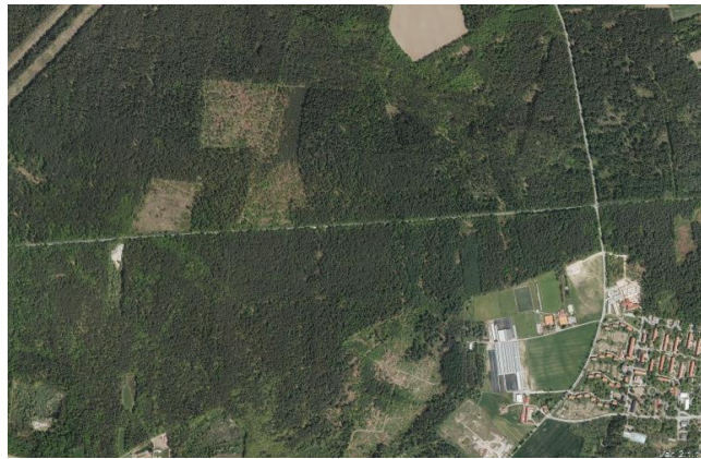
Slika1: Razprostrani gozdovi ob naselju Kidričevo

Kidričevo je znano po gozdovih, ki ga obdajajo. Že desetletja se o prebivalcih Kidričevega govori, da so Šumarji. Naziv je bil aktualen predvsem v devetdesetih letih, ko so se učenci šole »v prostem času« delili na Šumarje in vaščane. Vaščani so bili učenci, ki so prihajali iz okoliških vasi v šolo Kidričevo, Šumarji pa prebivalci naselja Kidričevo.