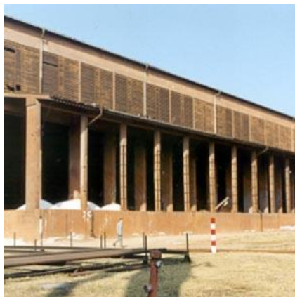
Slika 6: Pogled na najstarejši del tovarne, na skladišče in drobilnico boksita

Naslednja izmed registra je objekt skladišča boksita. Značilna industrijska hala za skladiščenje ima vzdolž celotne stavbe nadstrešek naslonjen na pilastre. Skelet je armiranobetonski, površine med konstrukcijo zastekljene ter zazidane z opečnimi zidaki. Vhodni del dvignjen zaradi lažjega razkladanja.