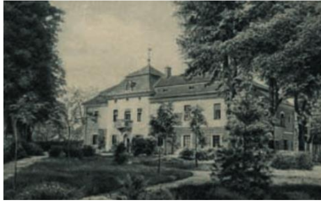
Slika 3: Razglednica dvorca Sternthal 1917-1918.