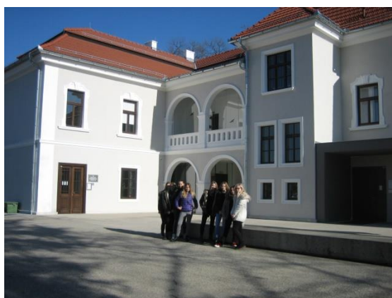
Sika 16: Kraj, kjer se nam pridruži škrat Šumar