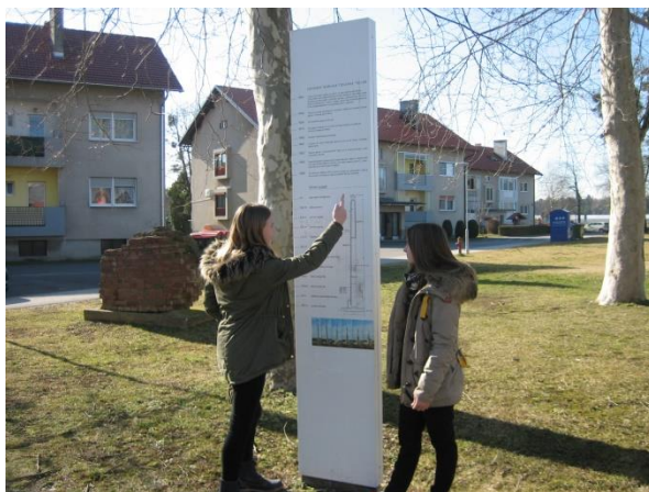
Slika 14: Preizkusile smo se v reševanju križanke