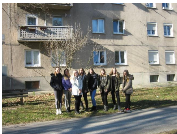
Slika 15: Pred naseljem blokov