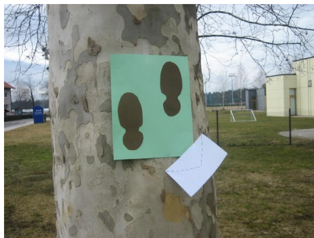
Slika 12: Le kam se je skrila škrat Šumar?

Na kulturno-turistični poti, ki smo jo na novo pripravili, so navodila za pot zapisana v pismih, ki jih je pripravil škrat Šumar. Animatorke na vsaki postaji povedo še nekaj dodatnih značilnosti, ki se nanaša na lokacijo postaje. V pismih se nahaja tudi namig o iskanju nadaljnjih stopinj škrata.