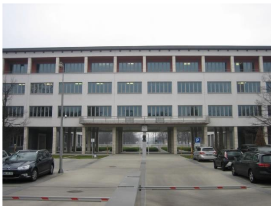
Slika 8: Upravna stavba podjetja Talum

Gre za objekt poslovne stavbe, Trinadstropna stavba vzdolžnega tlorisa z zaključnima stranskima traktoma, ki tvorijo tloris v obliki črke U. Stavba je delo arhitekta Danila Fuersta, ki je bila zasnovana med leti 1946-47. Leta 2002 prenovljena (J. J. Zadavec).