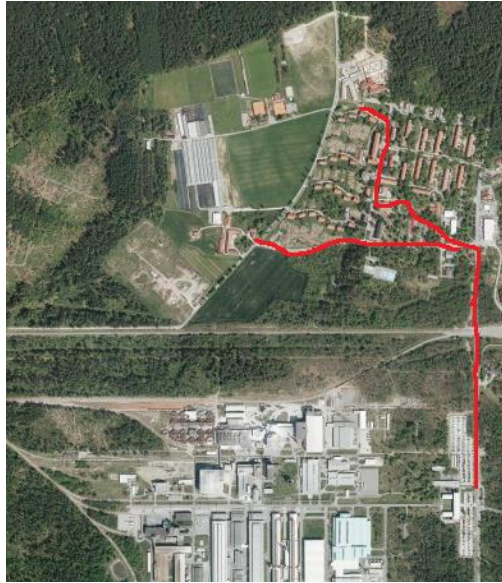
Slika 13: Kulturno-zgodovinska pot, po kateri se bomo sprehodili