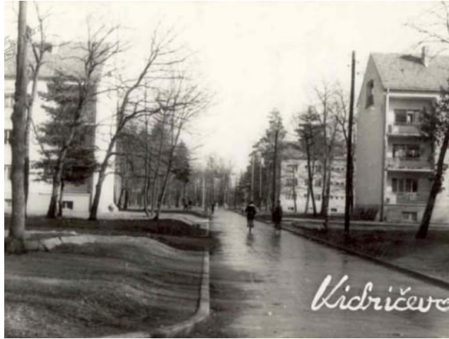
Slika 5: Danes kulturno zaščitenega naselja Kidričevo

Črno-bela fotografija prikazuje stanovanjsko naselje v Kidričevem, ki so ga začeli graditi kot naselje za zaposlene v tovarni glinice in aluminija l. 1947. Gradili so na ozemlju nekdanjih vojaških bolnišnic iz 1. sv. vojne v Strnišču, načrte je pripravil arhitekt Edo Ravnikar. Do l. 1954 je tako zraslo naselje z več kot 400 stanovanji, ki so ga l. 1953 po narodnem hedroju Borisu Kidriču preimenovali v Kidričevo