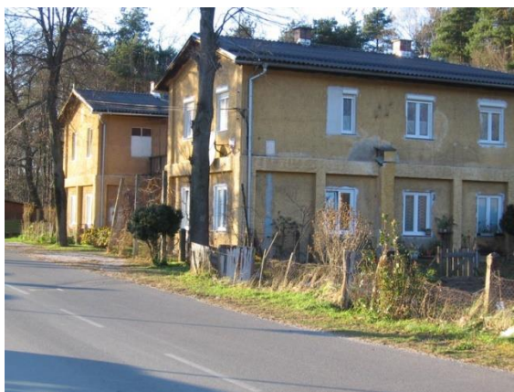
Slika 10: Stavba industrijsko naselje 1

Iz druge četrtine 20. stoletja poseduje občina stavbo z imenom Stavba Industrijsko naselje 1. Nadstropni objekt je tlorisno zasnovan v obliki črke U. Prvotno upravna stavba nemškega delovnega taborišča, po vojni do 1953 upravna stavba delovnega taborišča za obsojence. Preurejena je v stanovanja. Stavbno pohištvo je zamenjano.