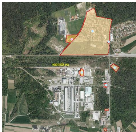
Slika 4: Prikaz objektov iz Registra kulturne dediščine za naselje Kidričevo

Da bi ugotovili, katere kulturne znamenitosti našega kraja so del registra nepremične kulturne dediščine, smo si ogledali register na spletu. Register dediščine (RKD) je uradna zbirka podatkov o nepremični kulturni dediščini na območju Republike Slovenije. register nepremične kulturne dediščine se vpisuje vso nepremično kulturno dediščino ne glede na vrsto, tip, obseg, lastništvo ali varstveni status enote.