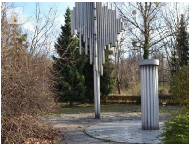
Slika 9: Spomenik Borisu Kidriču

Spomenik stoji ob glavni cesti ob vzhodnem robu Kidričevega in je bil več desetletij eden od razpoznavnih simbolov kraja. Bronasto plastiko Borisa Kidriča so neznanci ukradli v začetku leta 2011, zato je danes ohranjen le podstavek.