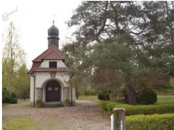
Slika 11: Ruska kapelica pri pokopališču

Zaščiteni so spominski objekt, vojaško pokopališče, nagrobnik in pokopališka kapela. Na opuščenem pokopališču iz 1915 je bilo med 1. svetovno vojno pokopanih 2340 vojakov različnih narodnosti, nekaj pokopanih tudi kasneje. Leta 1917 so postavili neobaročno kapelo s kakovostnim inventarjem. Obdano z betonsko ograjo z dvema portaloma. Pokopališče leži južno od železniške postaje v Kidričevem ter neposredno ob cerkvi, pri ledini Preloške šume.