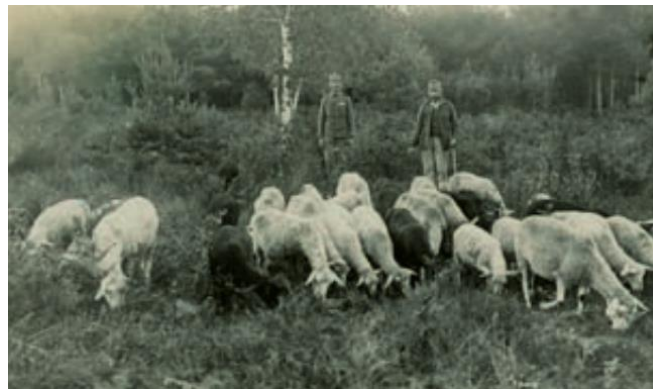
Slika 2: Gojenje ovc v Strnišču leta 1917

Sprva je zaselek dobil ime po graščinskih hlevih z ovni – Starstall (ovčji hlev), kakor je hleve imenoval nemški gospodar. Kasneje se je zanj izoblikovalo ime Sterntal ali Sternthal, kat ga različno pišejo zgodovinski viri. Novonastalo naselje Strnišče na Dravskem polju je štelo 60 prebivalcev (Kolar, 2007).