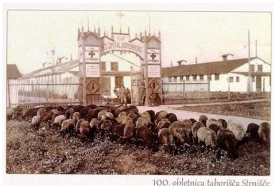
100. obletnica taborišča Strnišče

Glede na materialne pogoje šole in zastopanost teme v kraju in okolici bomo izbrali dva tematska sklopa izmed štirih, ki jih bomo obravnavali v 35 učnih urah. Del učnih ur se bo izvedel tudi v obliki terenskega dela.