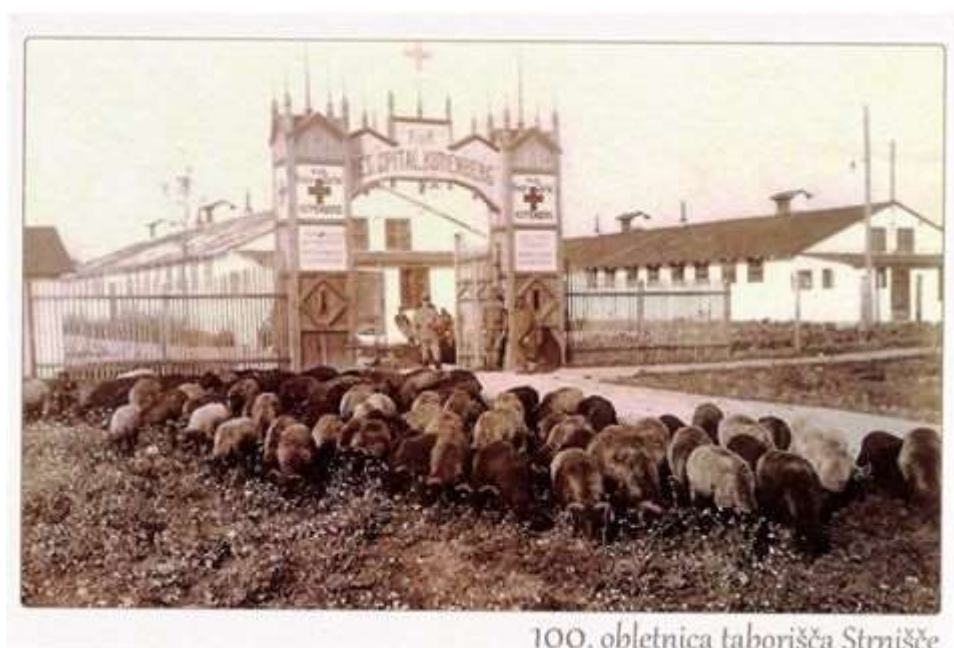
100. obletnica taborišča Strnišče

Glede na materialne pogoje šole in zastopanost teme v kraju in okolici bomo izbrali dva tematska sklopa izmed štirih, ki jih bomo obravnavali v 35 učnih urah. Del učnih ur se bo izvedel tudi v obliki terenskega dela.