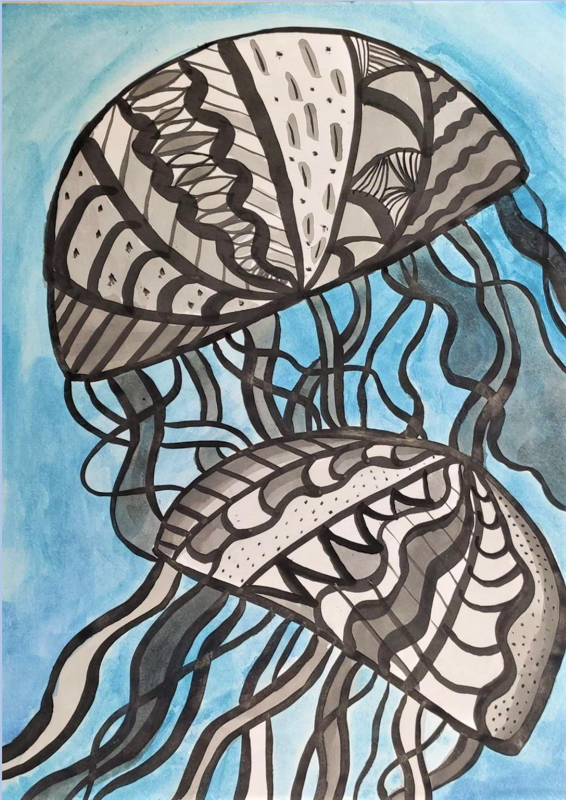
Ema Peričić, 7.razred