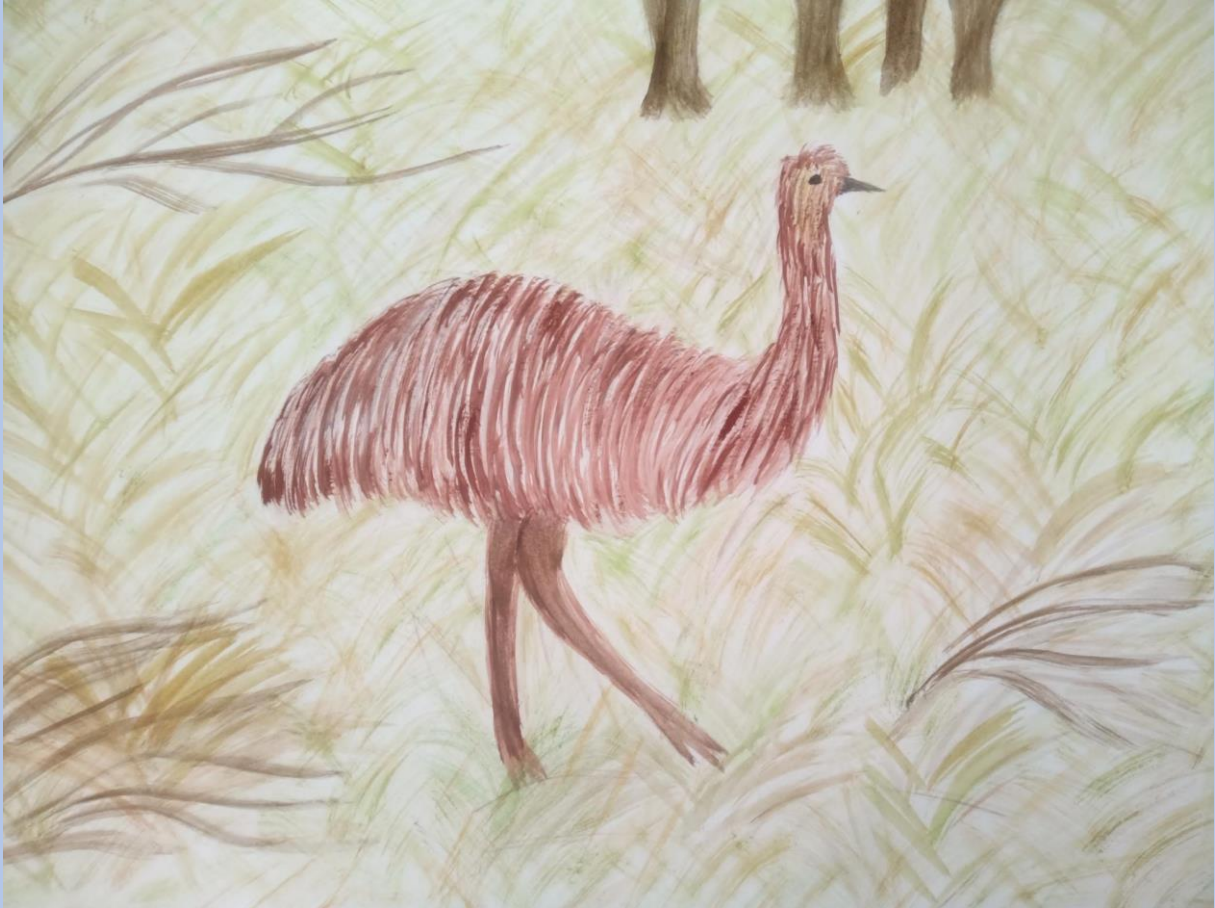
Demi Brelih, 5.razred