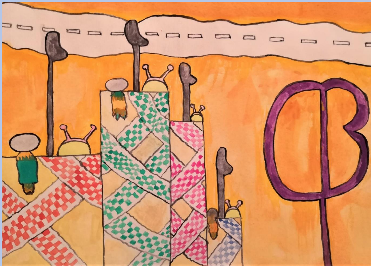
Demi Brelih, 5.razred