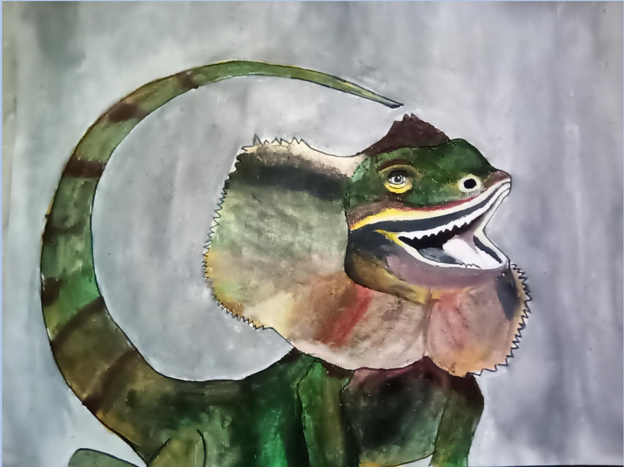
Mia Iljadica, 6.razred