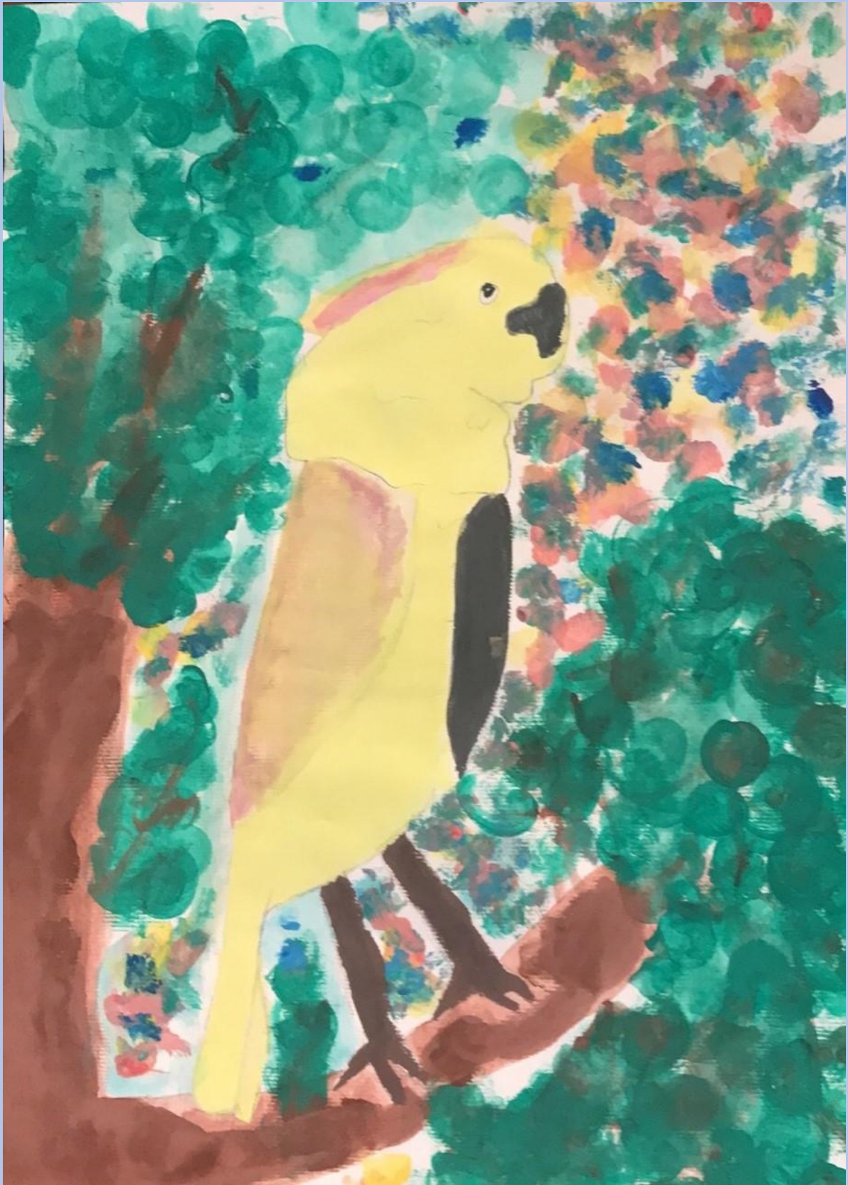
Nadin Ambrožič, 5.razred