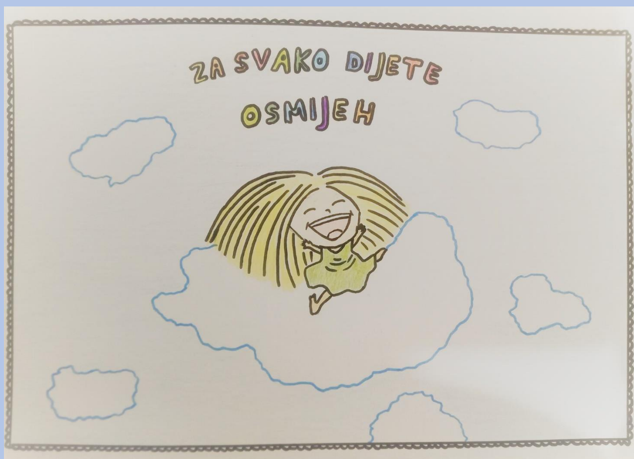
Demi Brelih, 5.razred