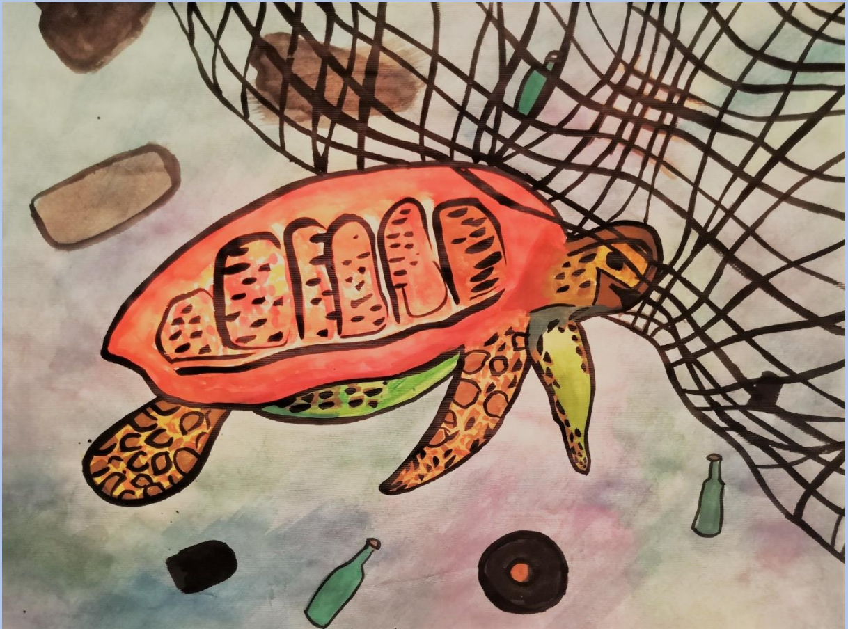
Bartol Reljac, 8.razred