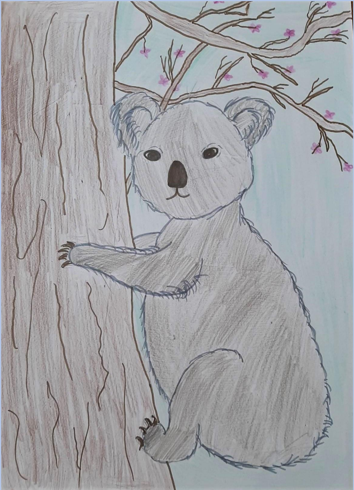
Ena Peričić, 6.razred