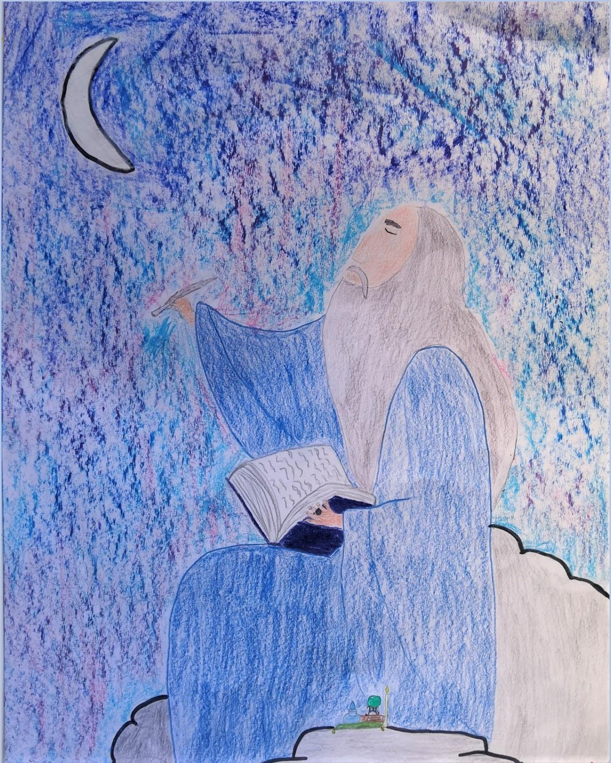
Petra Pavičić, 6.razred