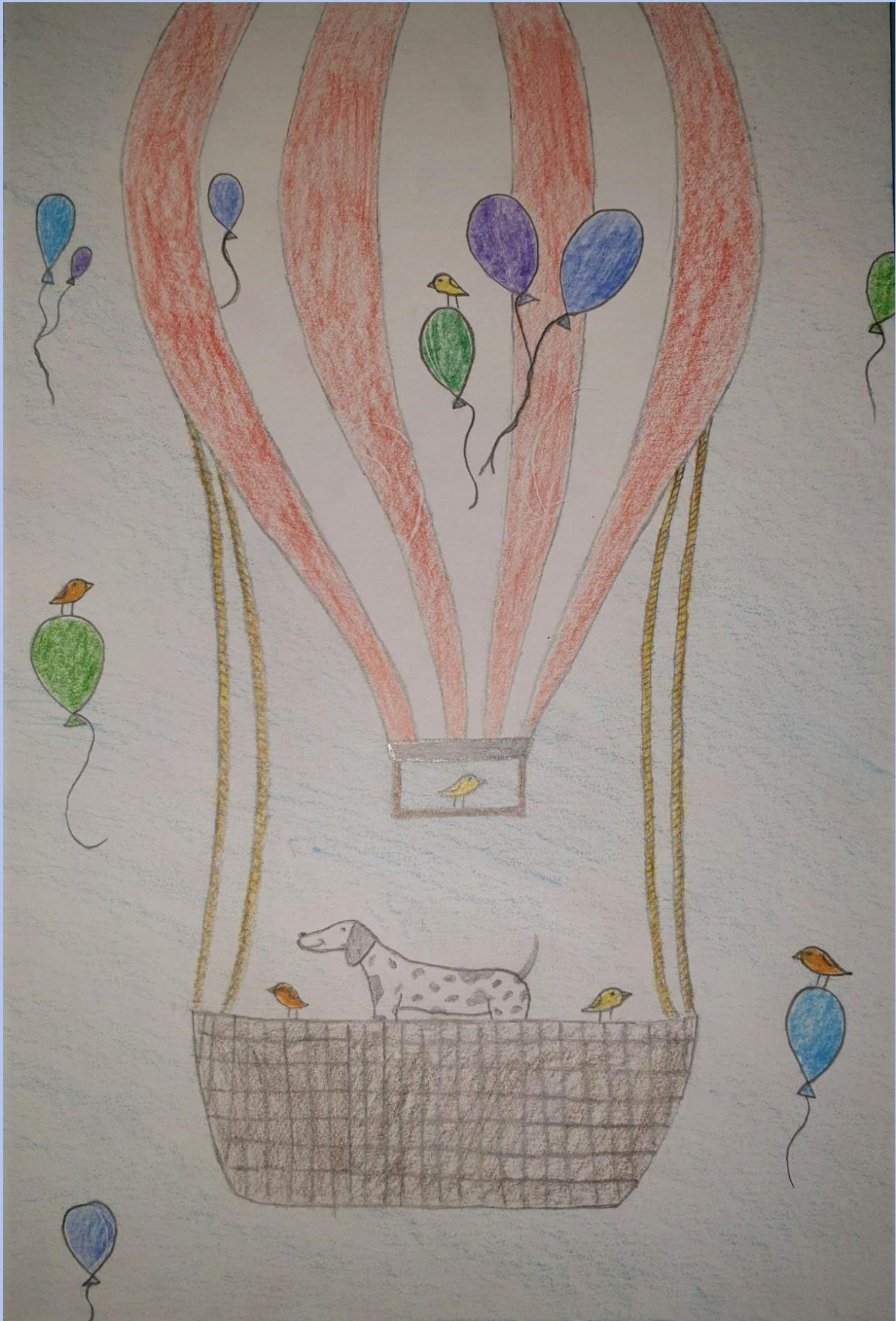
Roko Begonja, 8.razred