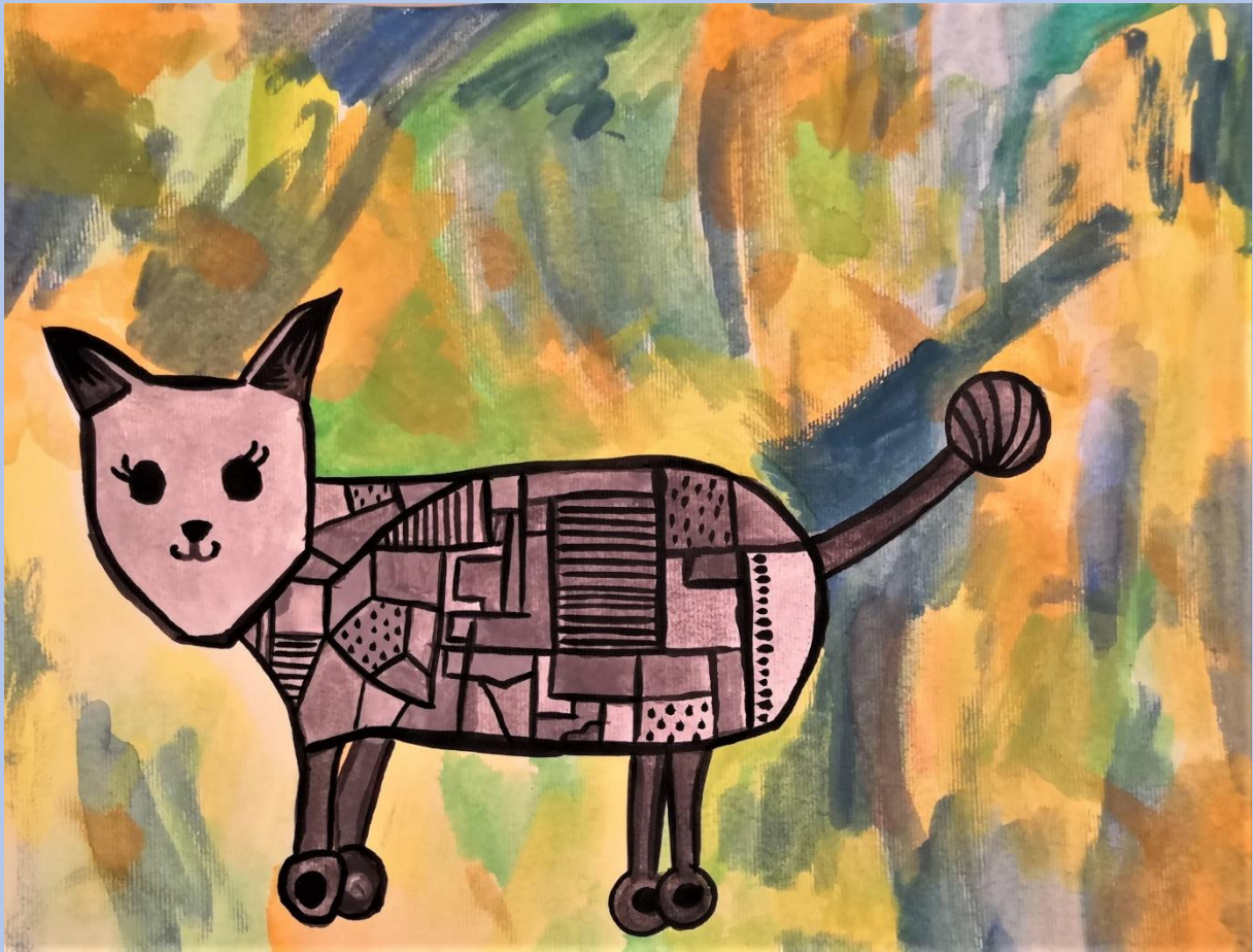
Nadin Ambrožić, 5.razred