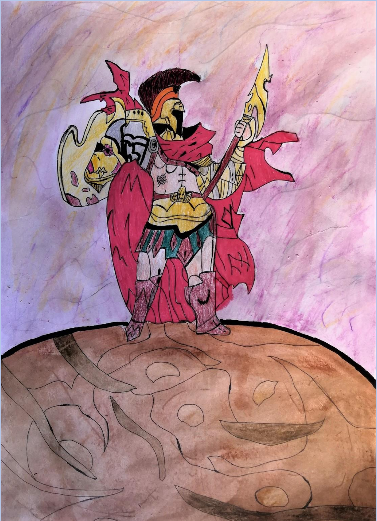
Leon Šepić, 7.razred