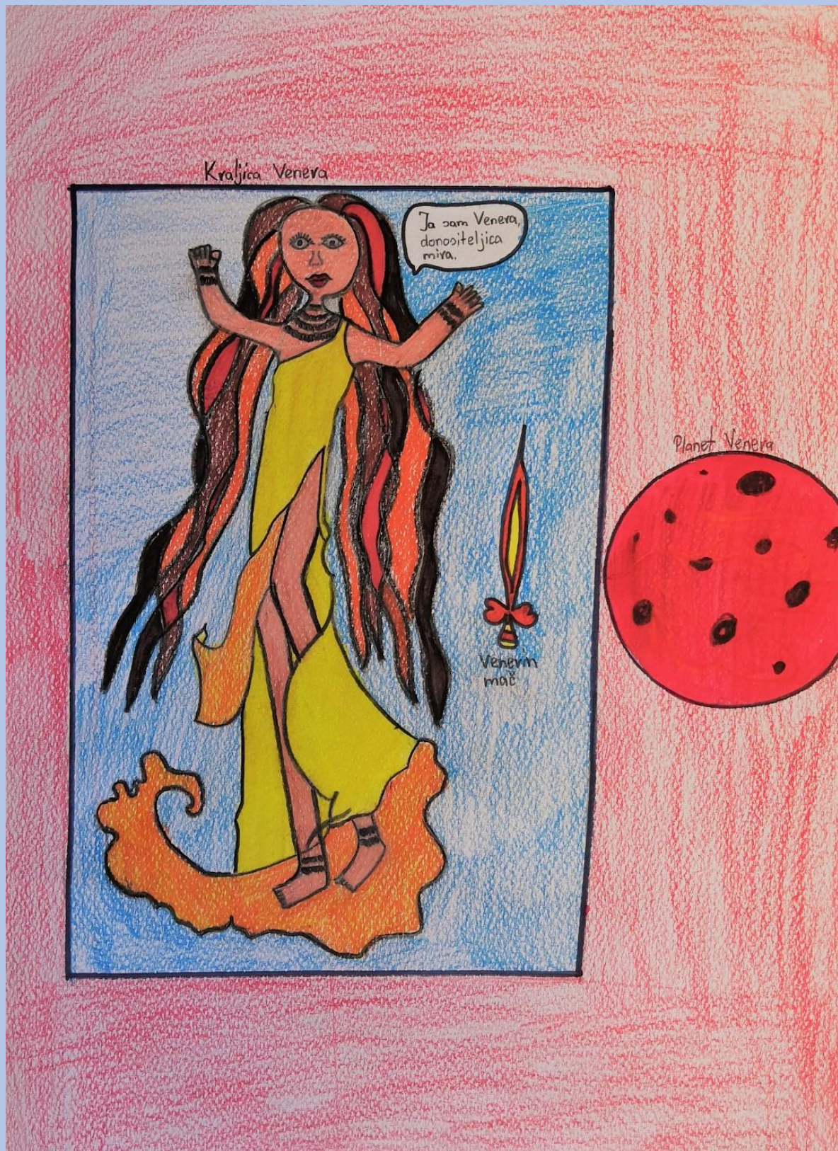
Debora Pehar, 5.razred

Ostali radovi koji su sudjelovali na natjecanju :