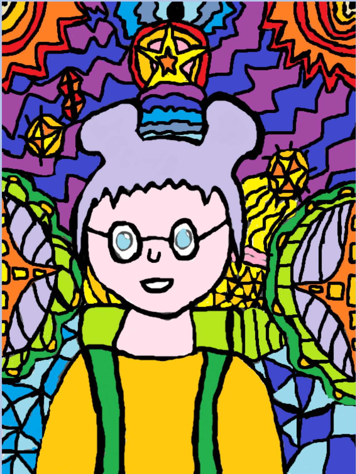
Leon Šepić, 7.razred