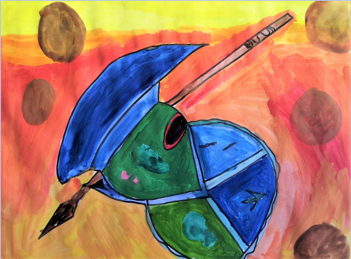
Niko Žutelija, 7.razred