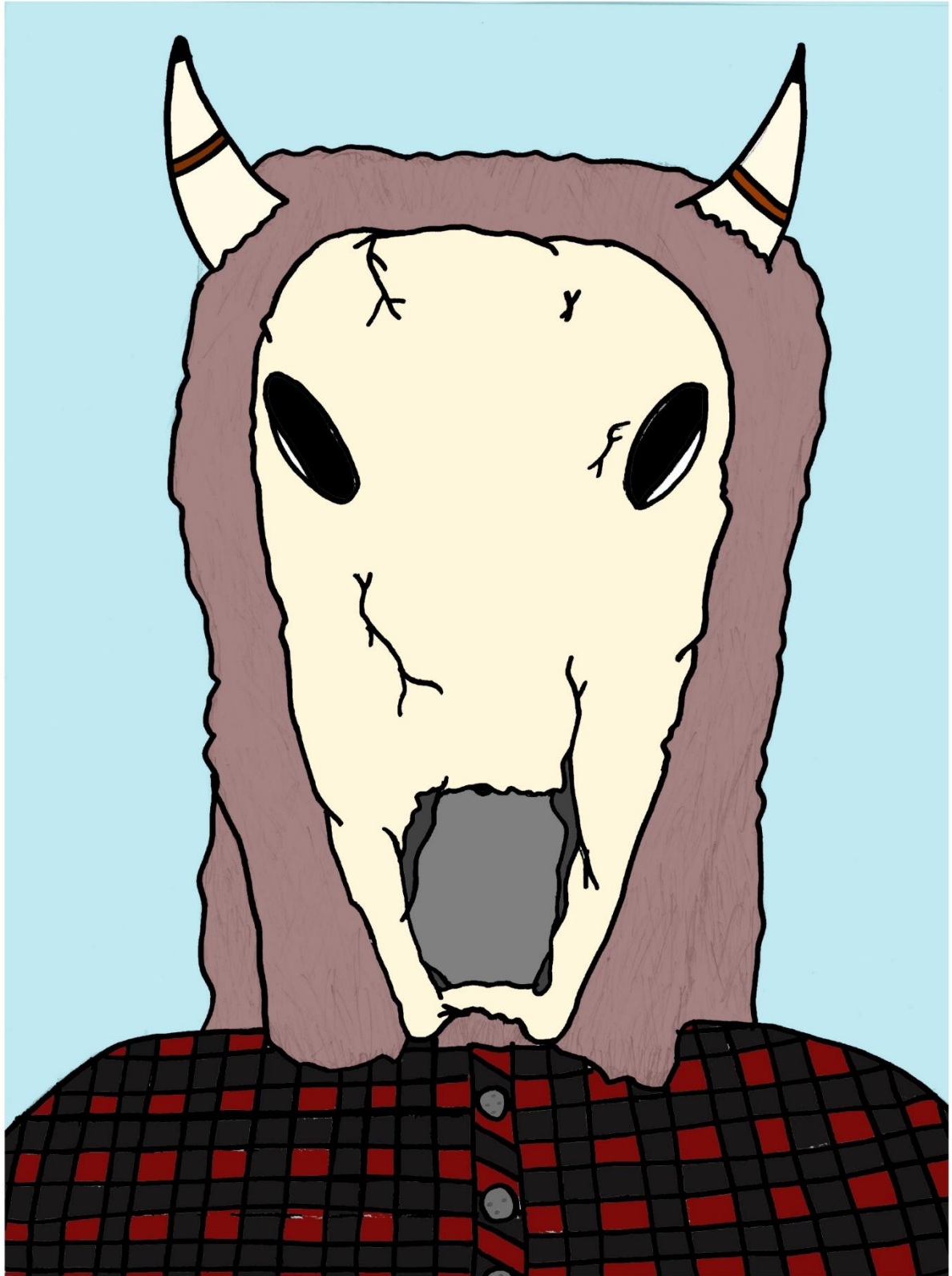
Roko Begonja, 8.razred