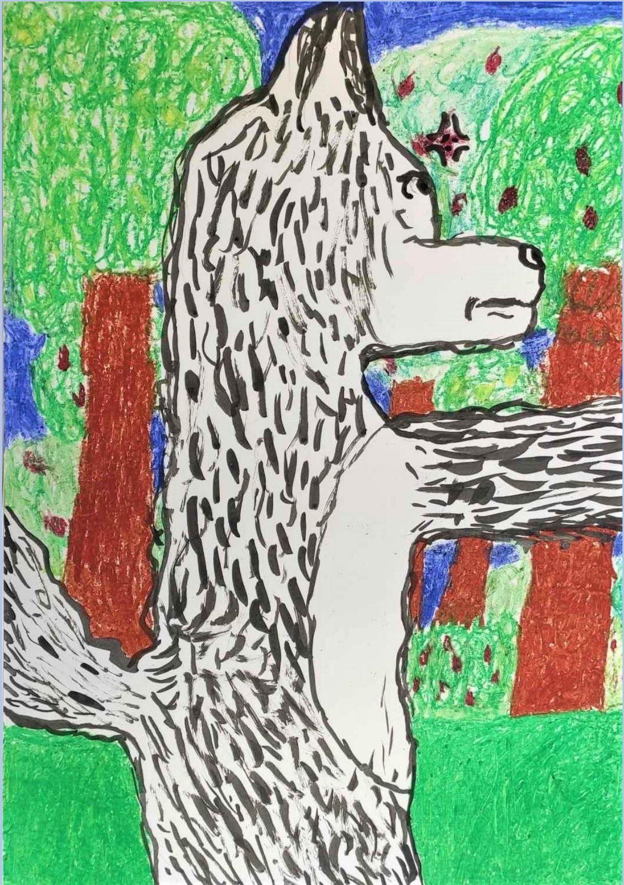
Lovro Klapan, 7.razred